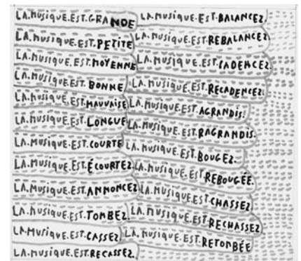
Michel Dave, "La musique", 2006

OSCAR HAUS (1939 -) aime l'accordéon et il le montre ! Dans ses dessins chatoyants réalisés avec beaucoup de concentration et d'application aux crayons de couleurs, il représente souvent les ténors de la musette (Yvette Horner, les frères Verschuere, ...). Il en apprécie d'autant plus les talents de virtuoses qu'il pratique également cet instrument complexe auquel il s'adonne avec autant de passion qu'au dessin. 1