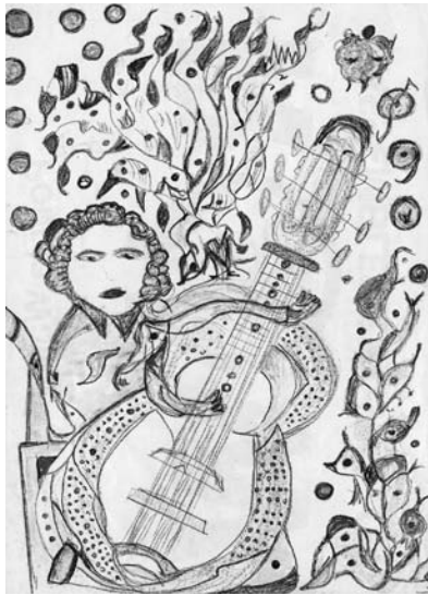
Martha Grunenwaldt, crayons de couleurs sur papier, coll. Art en Marge