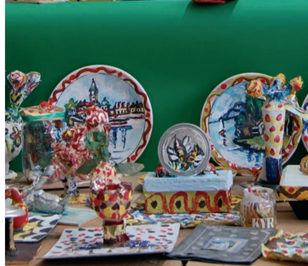
Anacleto Borghi, Coll. Atelier de peinture adriano e michele, san colombano al lambro