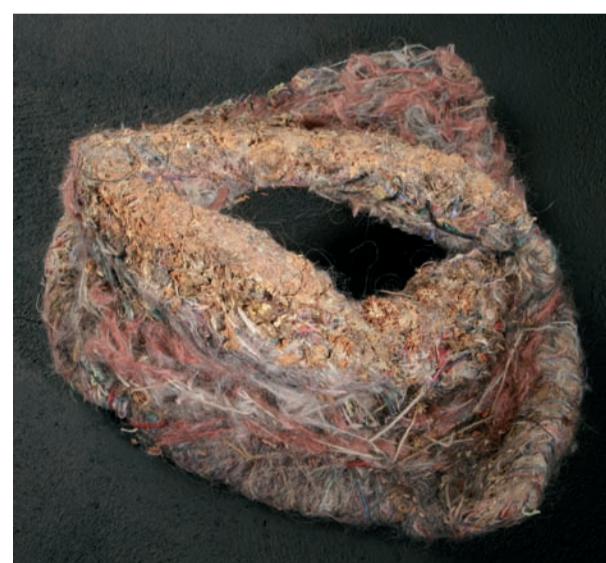
Hilde D'Hondt, Coll. Atelier Zonneliel