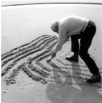
Raoul Ubac. Tracés sur plage I, 1971, 40 x 40cm.