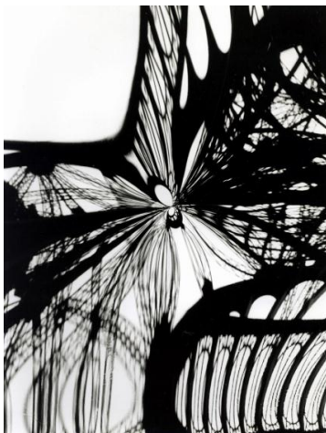
Pol Bury. 8500 tonnes de fer dans le miroir, 1971, 24 x 30 cm.

Du 19 janvier au 17 mars 2012, la Galerie Maeght propose une exposition de photographies de Clovis Prévost. S'y font face 38 photographies d'artistes au travail, parmi les plus grands de notre temps de Alexandre Calder à Jacques Monory, et 14 photographies d'art, notamment une magnifique série dédiée à l'architecture de Gaudí ainsi que d'étonnants clichés réalisés lors de l'exposition du Musée imaginaire d'André Malraux à la Fondation Maeght.