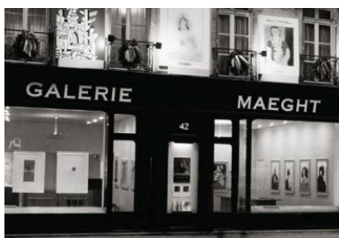
La Galerie Maeght de Paris, rue du Bac

19 grands formats 33 petits formats Dont une héliogravure d'Eduardo Chillida ( Chillida dans la forge de Saint Sébastien, mise en œuvre de la stèle Pablo Neruda, 1975, 40 x 30 cm ), 9 tirages vintage, 43 tirages modernes. Photos noir et blanc : tirage argentique. Photos couleurs : impression numérique sur papier baryté.