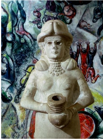
André Malraux. Pendant le tournage des films Les Métamorphoses du regard, Déesse et Chagall , 1973, 24 x 30 cm.