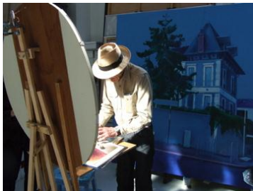
Jacques Monory. Hommage à Edward Hopper, 2007, 24 x 30 cm.