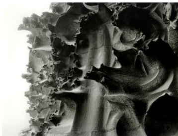
Antoni Gaudí. La Sagrada Família. Au Levant, la façade de la Nativité. Genèse d'un monde et floraison de pierre , 1964-1968, 30 x 40cm.