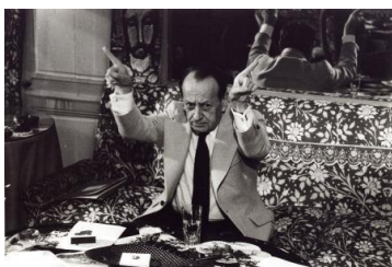
André Malraux. Pendant le tournage des films Les Métamorphoses du regard , 1973, 16 x 24cm.