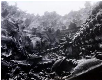
Antoni Gaudí. La Sagrada Família. Aux voussures du portail de la Charité. La nuit étoilée de Bethléem, 1964-1968, 40 x 50 cm.