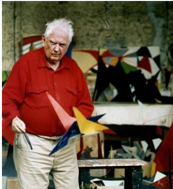
Alexander Calder. Calder peint la maquette d'un stable dans l'atelier François Ier, 1972, 40 x 40 cm.