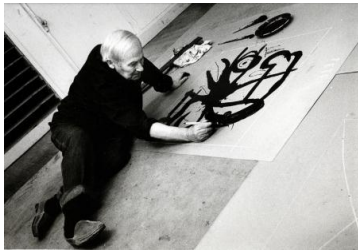
Joan Miró. Joan Miró travaillant sur une plaque de zinc I, 1971, 24 x 30 cm.