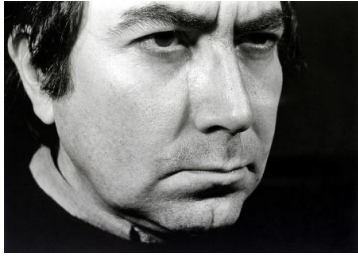
Antoni Tàpies. Pendant le tournage du film, Visage , 1969, 24 x 30 cm.