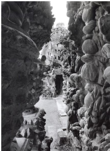
Ferdinand Cheval. La Tour de barbarie vue du Tombeau égyptien , 1965-1980, 30 x 24 cm.