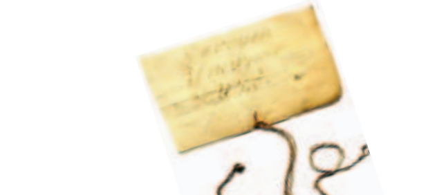
Billet trouvé sur enfant abandonné (Musée Flaubert et d'histoire de la médecine CHU-Hôpitaux de Rouen)

Entrée libre et gratuite dans la limite des places disponibles.