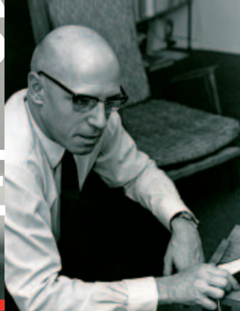
Michel Foucault.