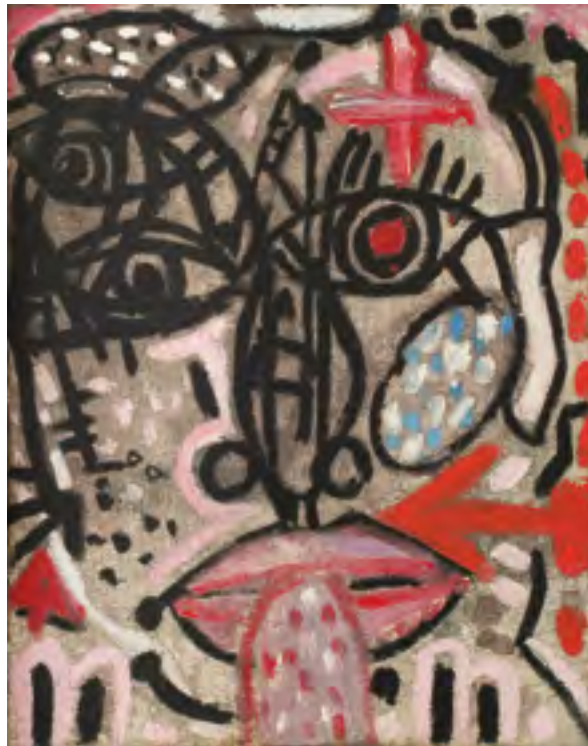
Circa 1965, huile sur toile, 24 x 19 cm

« La première pulsion est la réalité : le corps, moi, ce que je vois... Puis, les signes abstraits, les symboles arrivent. Très vite, je passe de la réalité aux symboles, puis aux couleurs, aux lignes, puis je reviens à cette réalité. Il y a un va et vient permanent entre ces différentes écritures. »