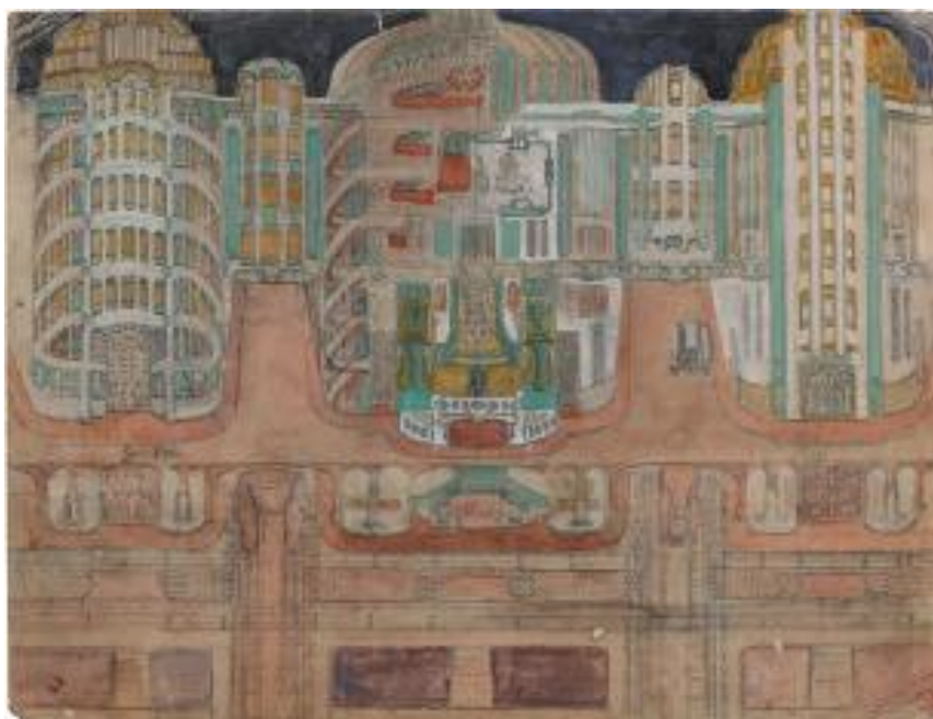
Sans titre , non daté, encres noire et de couleur sur page de cahier

Ces architectures, ouvrant parfois sur le monde du théâtre, ont particulièrement retenu l'attention d'Alain Bourbonnais. (extrait notice catalogue)