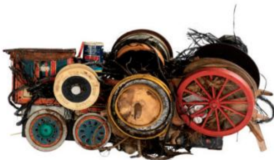
Sans titre, non daté, assemblage de matériaux divers, 20 x 30 cm