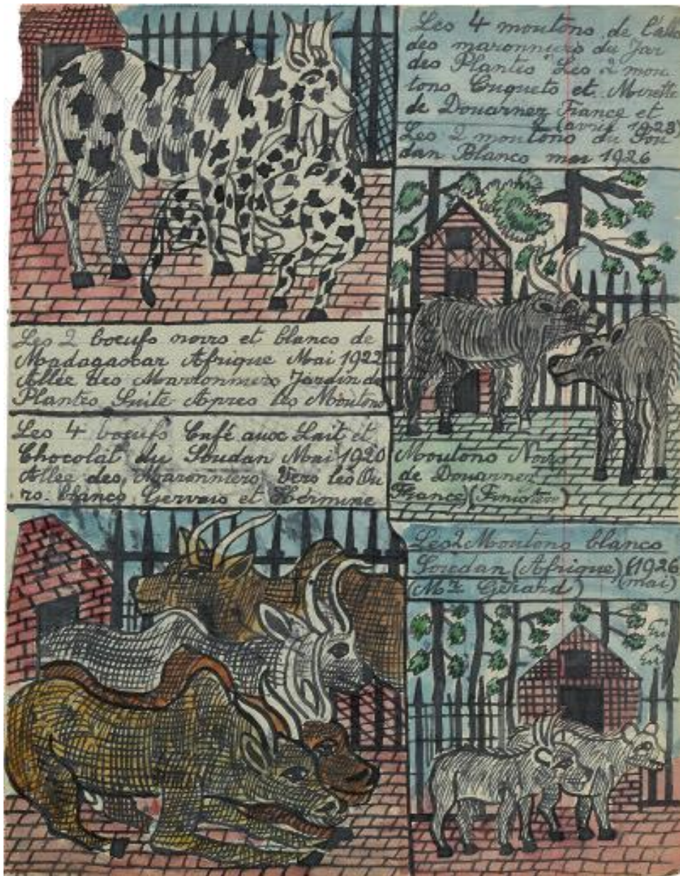
Sans titre, non daté encres noir et de couleur sur page de cahier 22 x 17 cm

FIN XIXE / DÉBUT XXE SIÈCLE, LOCALISATION INCONNUE (FRANCE)