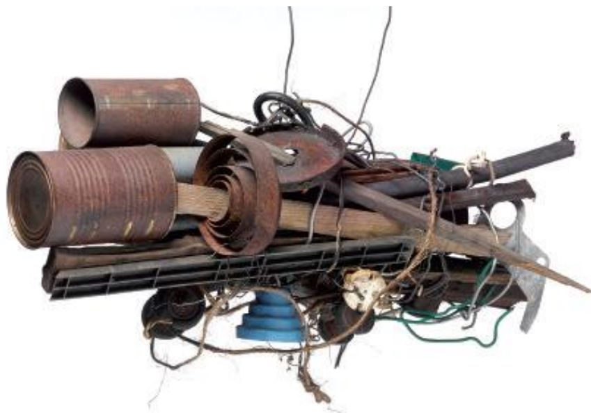
Sans titre, non daté, assemblage de matériaux divers, 16 x 40 cm

1916, AUGIREIN (FRANCE) / 1985, SAINT-LIZIER (FRANCE)