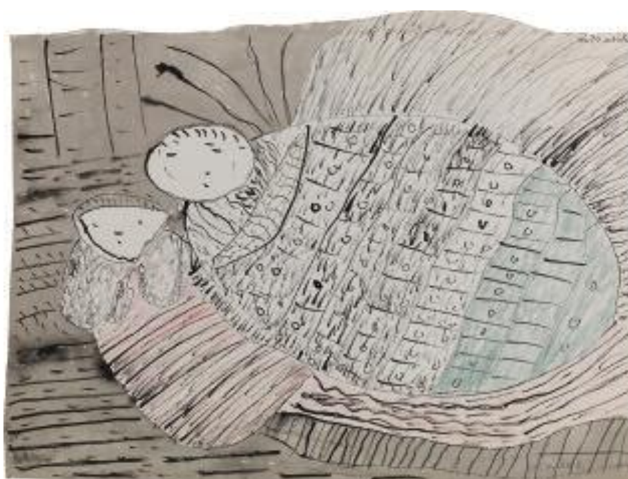
Personnages religieux , 20 octobre 1957 encre noire et crayon de couleur sur papier 30 x 41.5 cm