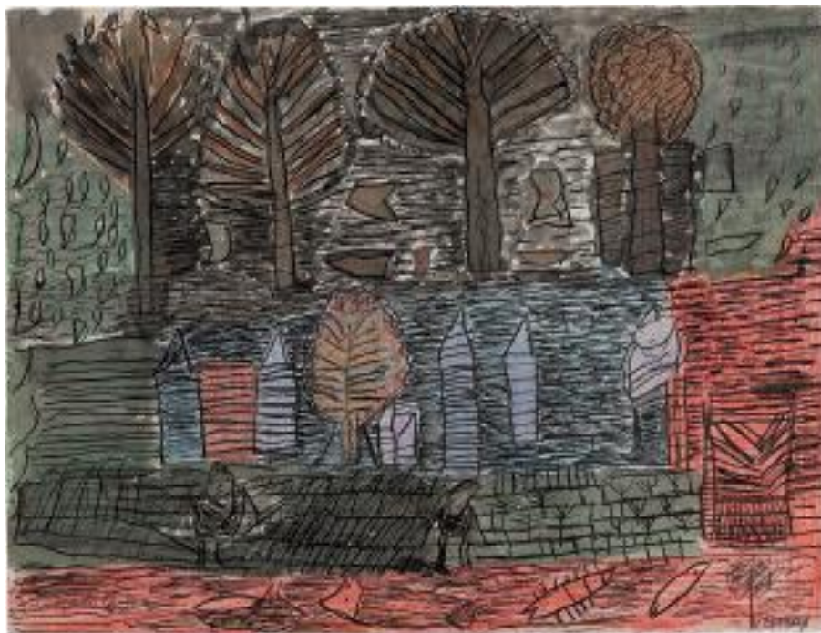
Sans titre , 1964 encre noire et crayon de couleur sur papier 24 x 31.5 cm

La collection réunit une série de dessins acquis en 1977 et présentés au public en 1978 à l'occasion des Singuliers de l'art à Paris. En 1977, Jacqueline B. écrit à Alain Bourbonnais : « Cher Monsieur Jacob, Je travaille beaucoup en ce moment pour que vous soyez content et faire une magnifique exposition. Je vous souhaite ainsi qu'à madame et vos demoiselles une heureuse année. » (extrait notice catalogue)