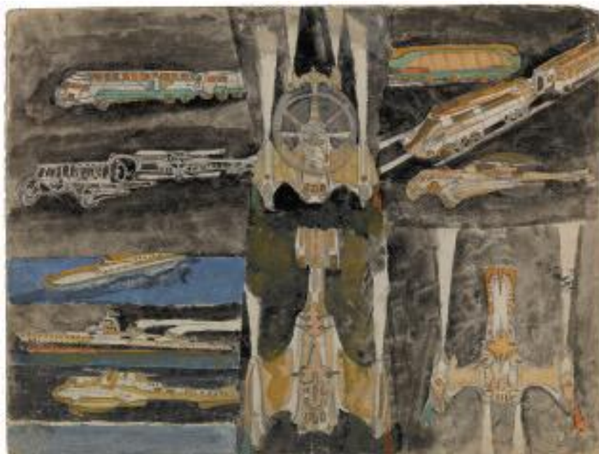
Sans titre , non daté aquarelle sur papier 24 x 31 cm

DÉBUT DU XXE SIÈCLE, (PORTUGAL) / 1976, AMIENS (FRANCE)